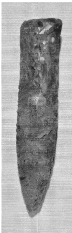
Flintdolk från Hamra

För mer än 115 000 år sedan började vårt land täckas av en inlandsis som mätte upp till tre kilometer i tjocklek. I tiotusentals år låg isen kvar men för omkring 11 000 år började den släppa sitt grepp om Småland och efter ytterligare ungefär 500 år var Finnveden och Draven isfria. Den bortdragande isen lämnade efter sig ett enormt sjöområde som sträckte sig från Jönköpingstrakten ner till gränsområdet Småland / Halland, den så kallade Stor eller Fornbolmen. Efter hand bildades i smala dalgångar de åar, som finns kvar än i dag. Storån med sin Lillå och Draven Lillå samlade vatten från stora delar av socknen och förde ut det i Bolmen.