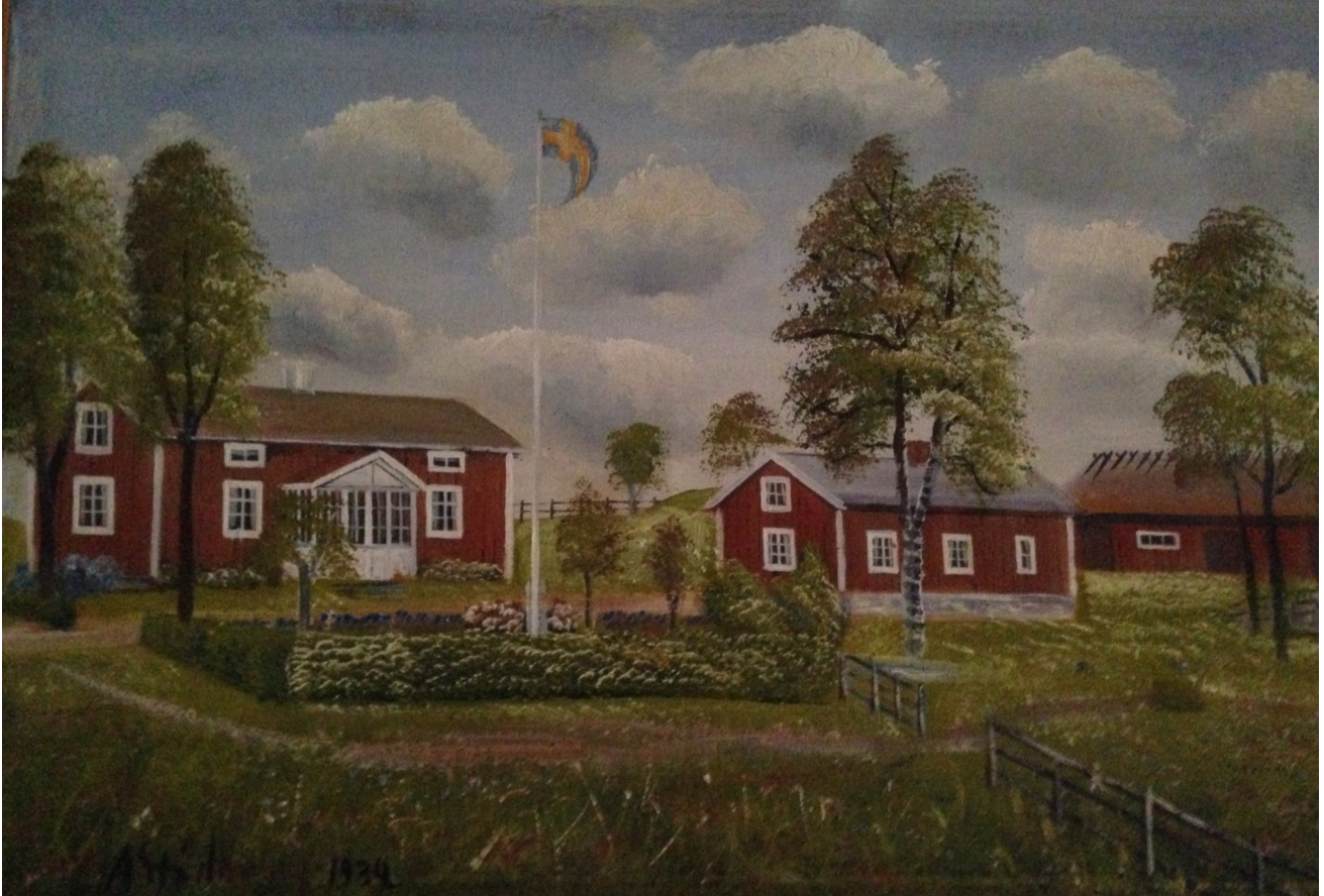
"Gåramålning" av Hamra Mellangård 5:13 från 1934 av Arvid Stödberg ( 1882– 1964 ) Smålands mest kände gåramålare.