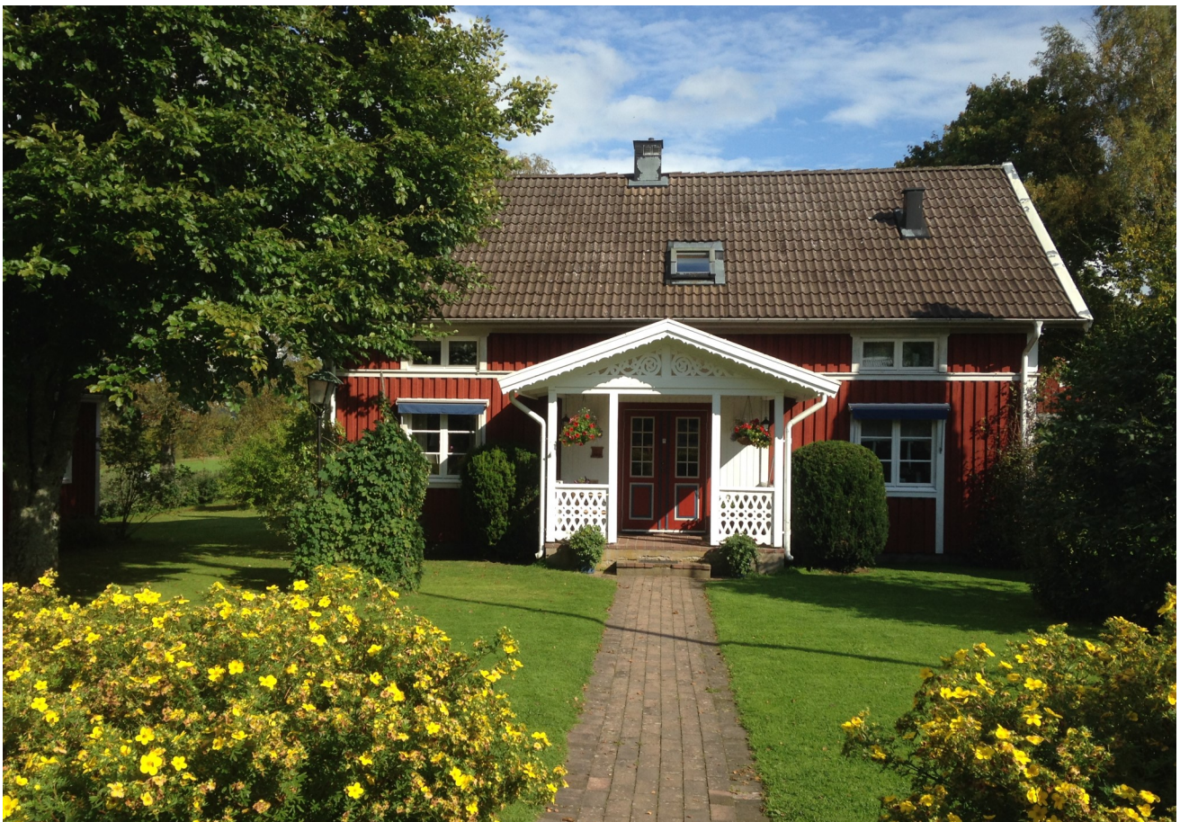
Hamra Mellangård 5:13 som det ser ut i dag. Ny byggnad från 1986 sammanbyggd med det gamla huset.