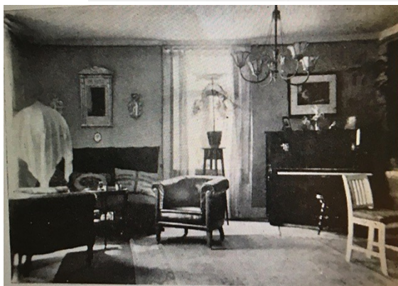
Sammanställt av Yvonne Öhrbom

ANNEBERGS PENSIONAT, 2,5 km. från Bredaryd station å linjen Värnamo—Halmstad. Härligt, skyddat läge. Cirka 100 meter från den vackra Annebergssjön. Utmärkt badstrand. Badhus, Roddbåt.